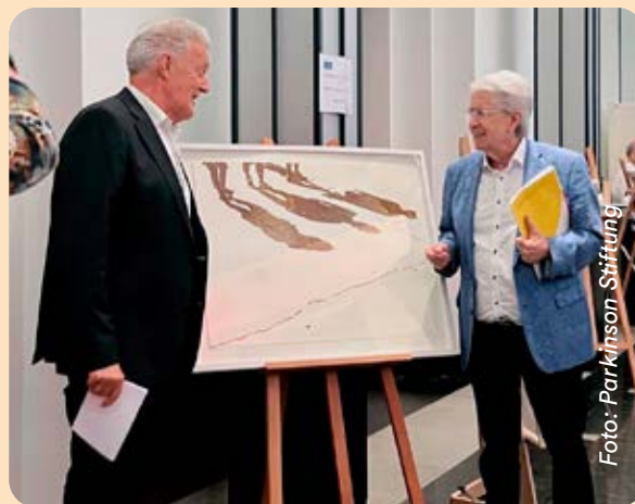
Moderator Max Moor (l.) begrüßte Frank Elstner, den Botschafter der Parkinson Stiftung, am 21. Juni 2024 bei der Benefiz-Auktion im Rahmen der Art Karlsruhe.

Unter dem Aspekt, Kunst kann helfen, Parkinson zu heilen, war die Benefizauktion ein voller Erfolg. Diese innovative Verbindung von Kunstmarkt und Forschungsförderung zeigt, wie kreative Fundraising-Ansätze neue Zielgruppen für die wichtige Arbeit der Parkinson Stiftung gewinnen können. Die Mittsommer-Auktion steht exemplarisch für das breite gesellschaftliche Engagement im Kampf gegen die Parkinson-Krankheit.